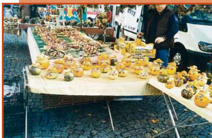
Originelle Stände erwarten die Besucher.