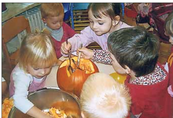
Die Kinder beim Kürbisschnitzen