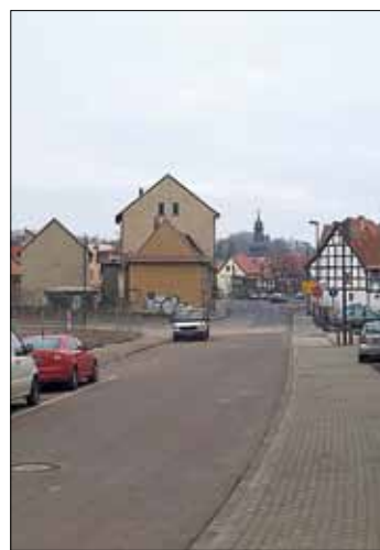
Seit 18.11.2011 ist die Breite Straße wieder für den Verkehr freigegeben.