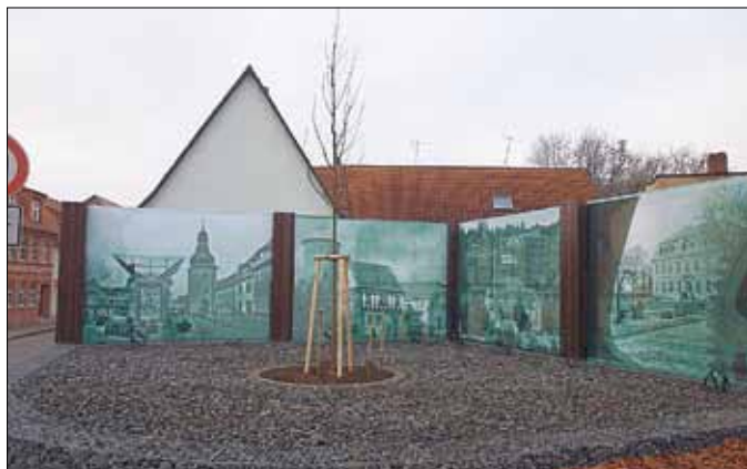
... schöne Ansichten der Stadt auf Leinwand