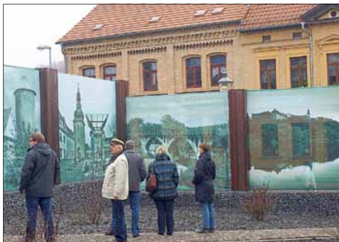
Zur Einweihung kamen viele Besucher