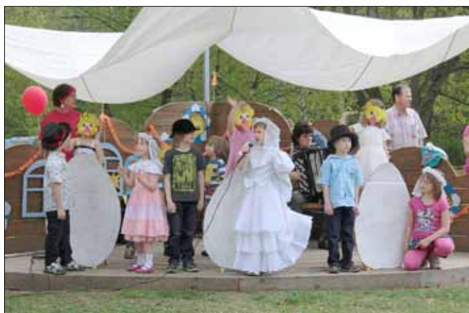
Liederprogramm „Wie ein Vogel zu fliegen ...“