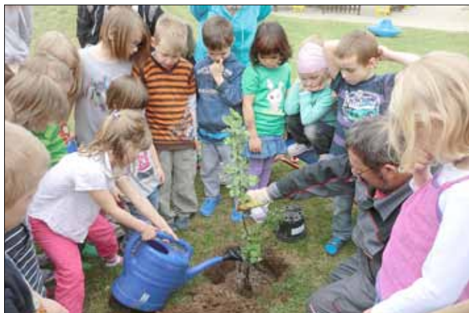
Ein Wildapfelbaum wurde gepflanzt.