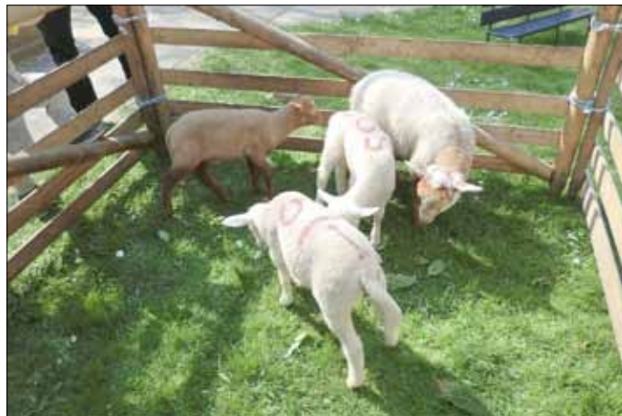
Lämmer zum Anfassen brachte Schäfer Hedel mit.