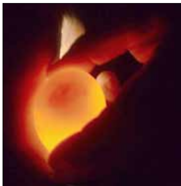
So sieht ein Ei nach 7 Tagen in der Brutmaschine aus. (Wenn man genau hinschaut, sieht man in der Mitte schon den Embryo)