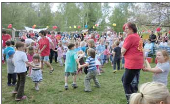
Ein tolles Fest ...