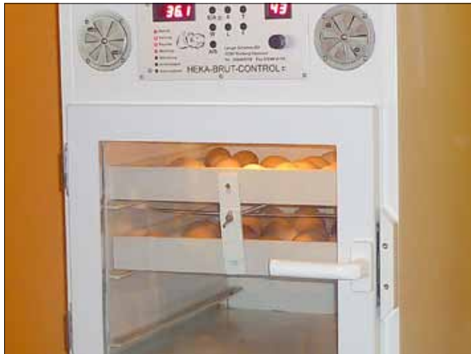
Besonders wichtig ist die Brutmaschine, sie übernimmt ja schließlich die Aufgabe der Glucke.