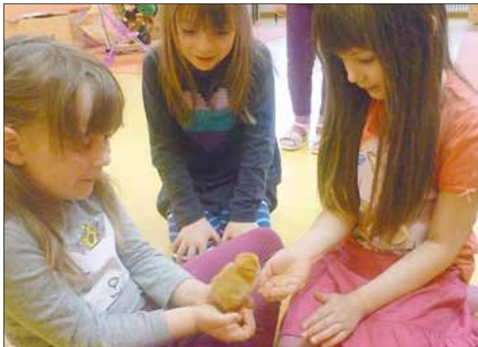
Das erste Küken ist geschlüpft! Juhu! Ihm geht es gut und sieht toll aus.