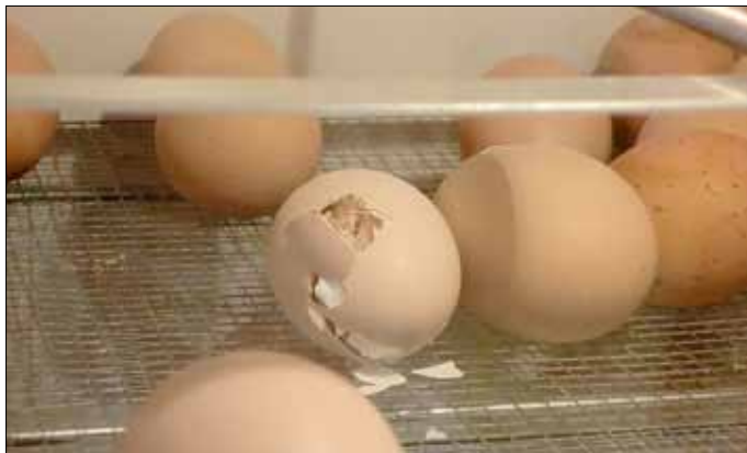
Auf diesem Bild könnt ihr erkennen, wie das Küken die Schale aufbricht ...