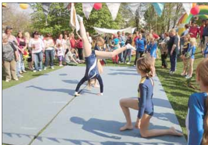
Die Turnerinnen von Blau-Weiß zeigen ihr Können.