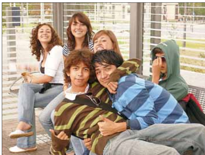
Kolumbianische Schüler suchen Gastfamilien