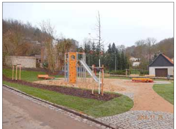
Neuer Spielplatz lädt zum Verweilen ein.

Das Vorhaben wurde im Rahmen des Programms Aktive Stadt- und Ortsteilzentren durch Bund und Land mit 2/3 der Gesamtkosten gefördert und ist ein gelungenes Beispiel für die Neugestaltung eines ruinösen Baugrundstücks.