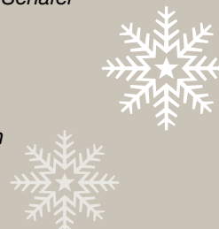
Roland Schäfer Bürgermeister der Stadt Bergkamen