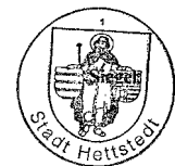
- Siegel -